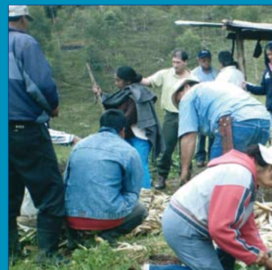
Sindicalistas de ASOINCA, profesores y padres en la creación de compst ecológica

La necesidad de construir políticas serias y sostenibles dirigidas a fortalecer la soberanía alimentaria en la comunidad educativa (formada por familias, educadores y niños), llevó a plantear la necesidad de disponer de sistemas productivos locales propios, naciendo de este modo el proyecto de huerta familiar en diversos centro educativos. En el centro "Vueltas de Patico", en el año 2007, se dan los primeros pasos gracias a dos proyectos transversales que se complementan: